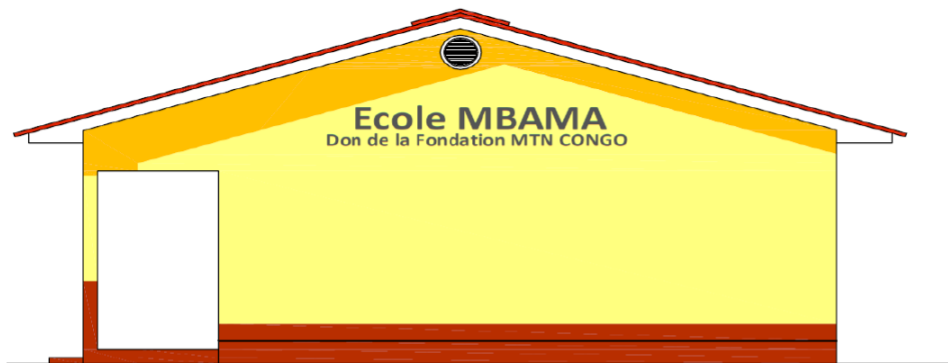
FACADE LATERALE DROITE